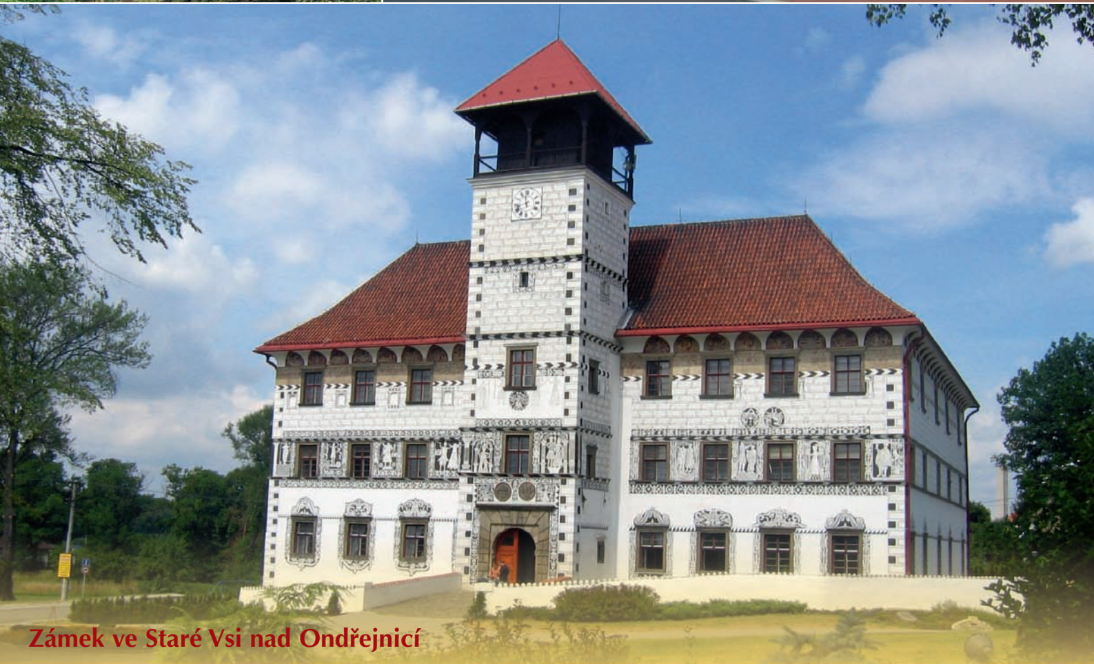
Zámek ve Staré Vsi nad Ondřejnicí